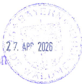
Ackermann Erster Bürgermeister