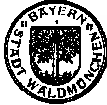
Ackermann Erster Bürgermeister